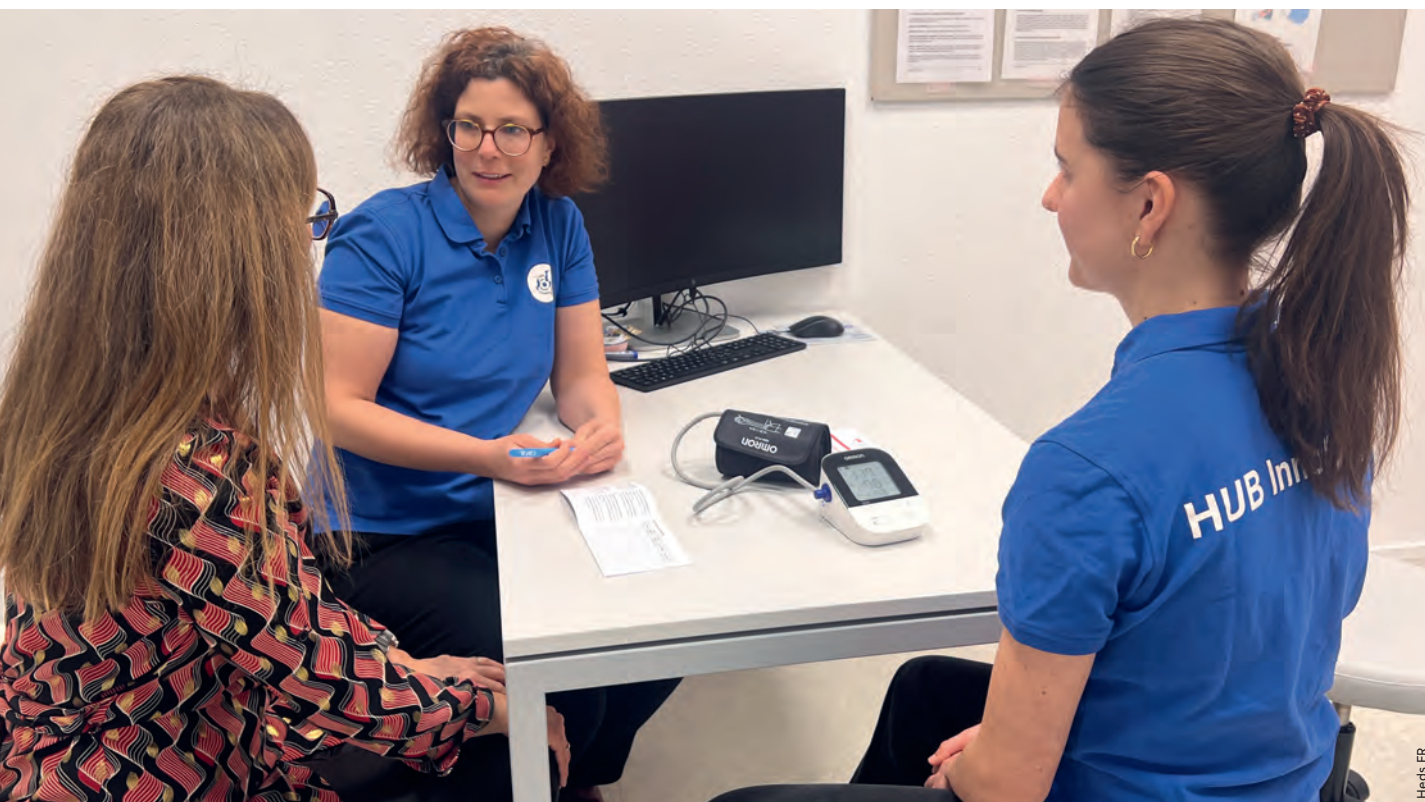
Une étudiante (à droite), son enseignante et une patiente au HUB InnoSanté, pour le bilan de l'autogestion concernant la surveillance de la tension artérielle.